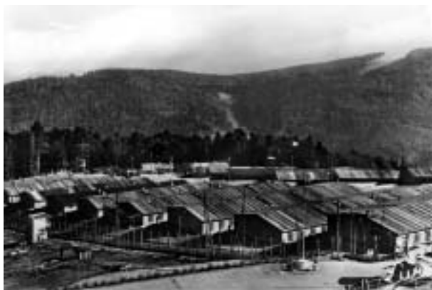
Vue générale du camp de Natzweiler.

23 septembre 1943 part de Berlin à destination des commandants de l'ensemble des camps de concentration allemands, ordonnant de "transférer immédiatement tous les détenus d'origine germanique à Natzweiler-Struthof". Il est surnommé "l'Enfer d'Alsace" par les Anglais ou "le camp de la Fin" par les détenus.