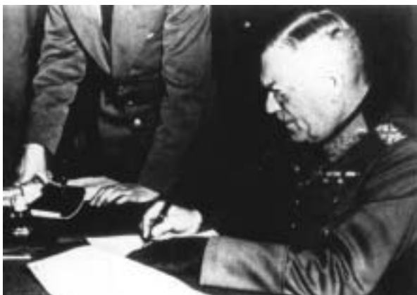
Le 9 mai 1945, à Berlin, le maréchal Keitel signe l'acte de capitulation de la Wehrmacht.

Wilhelm Keitel (Helmsherde, 1882 – Nuremberg, 1946) :