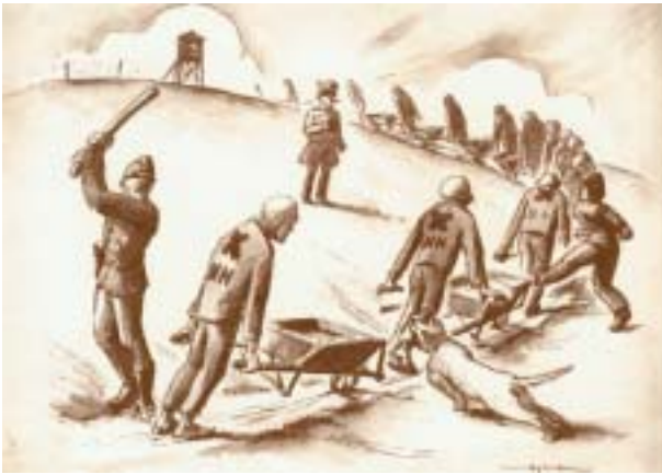
Le travail - "Le kommando des brouettes", dessin d'Henri Gayot. (Reproduit avec l'aimable autorisation de son fils, André Gayot)

Le 30 juillet 1944, dans le sillage de la débâcle allemande, et pour ne laisser aucune trace de ce processus d'extermination, la procédure Nuit et brouillard disparaît. Ordre est donné de supprimer les déportés NN . Le camp de Natzweiler est évacué peu avant l'arrivée des troupes alliées. La majorité des déportés est envoyée à Dachau. Quant aux camps annexes, certains subissent le supplice des "marches de la mort", interminables pérégrinations qui entraînent le plus souvent le décès des déportés exténués et affamés. Au total, les historiens allemands qui, après la guerre, se sont penchés sur la question, estiment que sur les 22 000 victimes du camp de Natzweiler et de ses annexes, près de 7 000 sont des prisonniers NN déportés de France (5 000 à 6 000), des Pays-Bas, de Belgique, du Luxembourg et de Norvège. Ceux qui en reviendront seront marqués à jamais, victimes d'un système où tout concourrait à déshumaniser des combattants de la liberté.